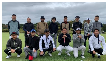
チャリティーゴルフコンペ

毎年行っている、チャリティーゴルフコンペで集まった募金をNPO法人宮城県患者・家族団体連絡協議会に寄付するなど、社会貢献事業にも力を入れています。