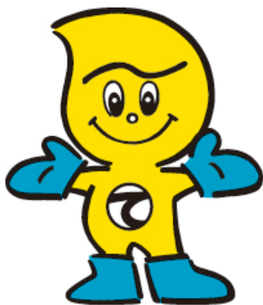
産業廃棄物適正処理のマスコット 「てき丸君」